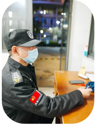
保安夜晚严守校门

校门口穿着制服的保安、宿舍楼下热情的宿管、校园角落里默默打扫的环卫人员、通过网络连线的网课师生、每天准时来为大家核酸检测的“大白”、主动承担校园服务工作的住校志愿者以及疫情防控各工作组的教职职工……总有人白天黑夜坚守校园，总有人晨光熹微时开始忙碌的一天，日落西山后依然辛劳不息。在五一劳动节前夕，让我们一起致敬劳模精神、工匠精神、劳动精神，致敬职大的最美劳动者，向身边的“TA”道一声最诚挚的感谢。