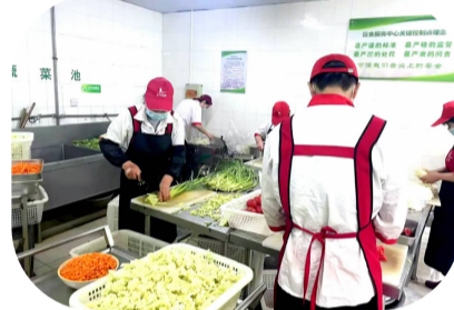
食堂工作人员保障伙食供应