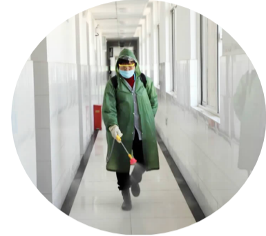
楼栋保洁员日常消杀