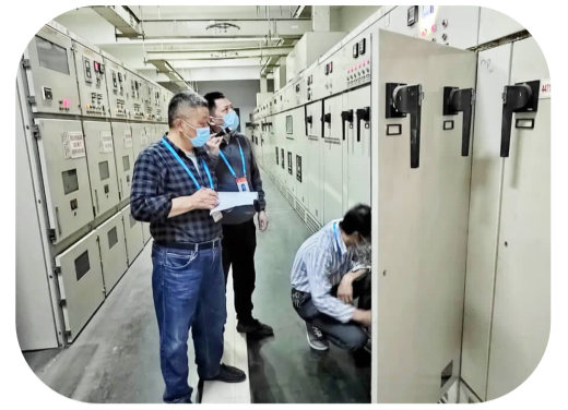
电房工作人员保障电力供应

校门口穿着制服的保安、宿舍楼下热情的宿管、校园角落里默默打扫的环卫人员、通过网络连线的网课师生、每天准时来为大家核酸检测的“大白”、主动承担校园服务工作的住校志愿者以及疫情防控各工作组的教职职工……总有人白天黑夜坚守校园，总有人晨光熹微时开始忙碌的一天，日落西山后依然辛劳不息。在五一劳动节前夕，让我们一起致敬劳模精神、工匠精神、劳动精神，致敬职大的最美劳动者，向身边的“TA”道一声最诚挚的感谢。