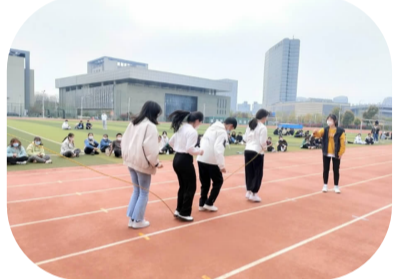
住校师生在操场等区域开展文体体育活动