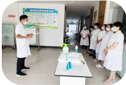
校卫生所开展院感防控、消毒消杀个人防护培训