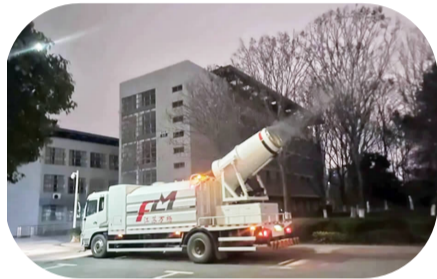
消杀人员夜间用消毒车